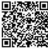
โบสมัครรับเลือกตั้ง ส.ถ./ผ.ถ. 4/1

ทั้งนี้ สามารถศึกษารายละเอียดเพิ่มเติมได้จากพระราชบัญญัติการเลือกตั้งสมาชิกสภาท้องถิ่นหรือผู้บริหารท้องถิ่น พ.ศ. 2562 แก้ไขเพิ่มเติม (ฉบับที่ 2) พ.ศ. 2566 พระราชบัญญัติเทศบาล พ.ศ.2496 (แก้ไขเพิ่มเติมถึงฉบับที่ 14) พ.ศ.2562 หรือทางเว็บไซต์สำนักงานคณะกรรมการการเลือกตั้ง www.ect.go.th และสามารถขอทราบรายละเอียดเพิ่มเติมได้ที่สำนักงานเทศบาล หรือสำนักงานคณะกรรมการการเลือกตั้งประจำจังหวัดทุกจังหวัด หรือบริการสายด่วน 1444 หรือ Application Smart Vote